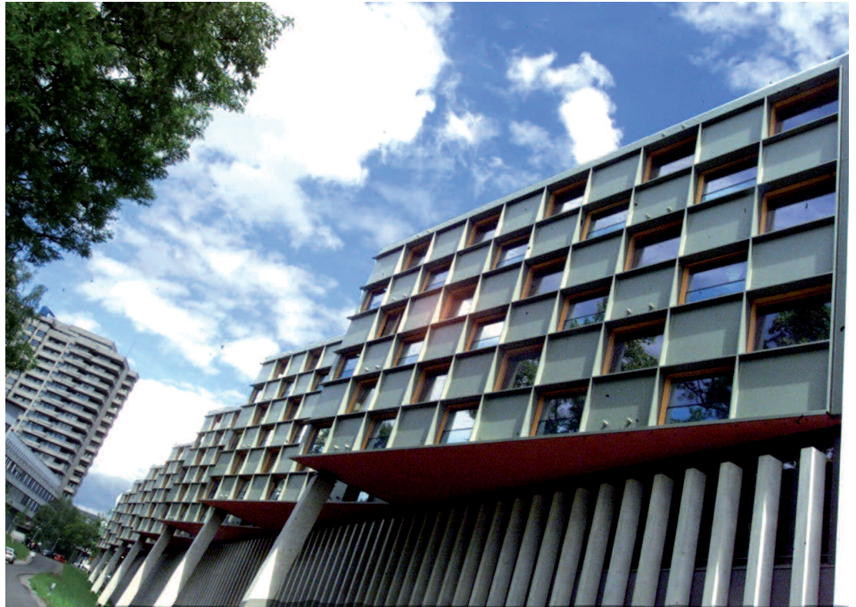
Nouveau modèle de fourniture de soins: dès l'année prochaine à travers la Suisse, les patients pourront choisir librement parmi les hôpitaux de la liste officielle.

Depuis le dernier trimestre 2010, la BEKAG prend part aux réunions relatives au projet du Conseil-exécutif, de la Direction de la santé et de la prévoyance sociale et de la Direction de l'instruction publique, en vue de «Renforcer la place médicale Berne». Il y représente les intérêts du corps des médecins praticiens. Ce projet ambitieux, axé sur le long terme, s'étendra encore sur plusieurs années. Les intérêts des protagonistes directs et indirects (SAP, Inselspital, Spital Netz Bern AG, Université de Berne, Direction de l'instruction publique, Société des Médecins du canton de Berne, Conseil-exécutif) sont multiples. Les discussions et le travail en réunion sont