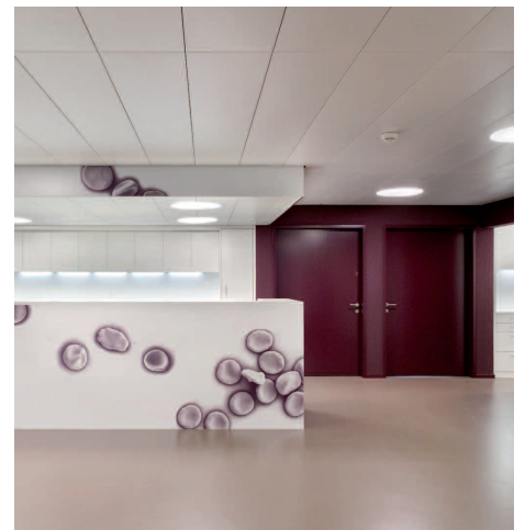
Le centre de médecins d'Oberhasli: Un modèle d'entreprise exemplaire.