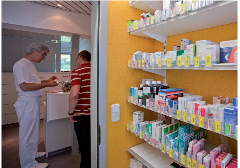
Auto-dispense. Les conséquences non désirées, pronostiquées par les médecins, sont survenues.