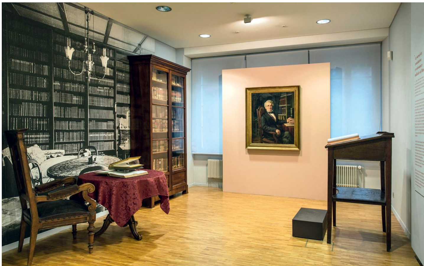
Vue de l'exposition: la chambre d'étude de Bloesch.

se base moins sur sa formation académique que sur son expérience propre, réfléchie et notée systématiquement.