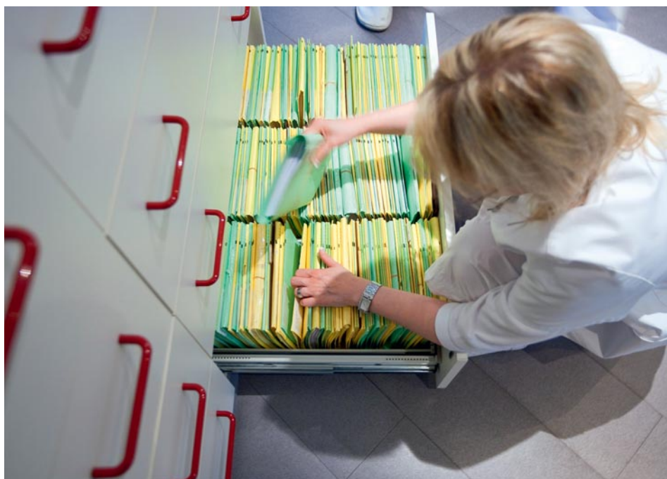
Avec le nouveau brevet fédéral, les assistantes médicales peuvent suivre une formation pour devenir manager de cabinet.