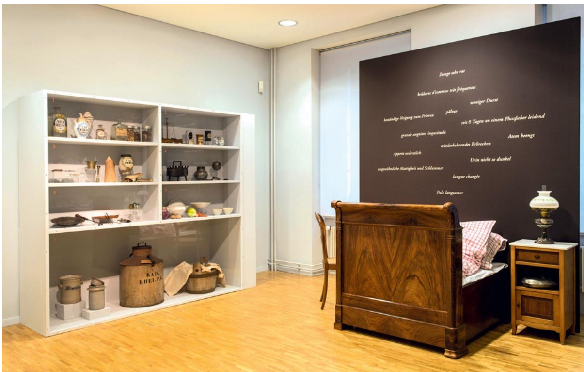
Vue de l'exposition: les produits thérapeutiques.

tout de même 13% chez Bloesch. Et ce groupe était responsable de 60% de tous les traitements de Bloesch. Le cabinet du médecin de Bienne était donc encore plus qu'aujourd'hui marqué par une clientèle régulière. Il semble que nous devrions revoir notre conception selon laquelle on allait autrefois chez le médecin essentiellement en cas de maladies graves, aiguës. Bloesch a accompagné pendant des années des patients avec des souffrances chroniques, et souvent aussi des patients avec des troubles changeants, non menaçants tels que des vertiges, des maux de tête, des troubles du sommeil, des sautes d'humeur, des paresthésies, des éructations, etc. Alors, était-ce une sorte de médecine psychosociale avant la lettre? Est-ce que les médecins croyaient à leur réussite? Et les patients? De quelles couches sociales venaient-ils? Comment étaient-ils examinés, comment étaient-ils traités? Combien est-ce que cela coûtait? A qui s'adressait-on lorsque l'on n'allait pas chez le médecin? L'exposition donne des réponses à ces questions, ainsi qu'à d'autres.