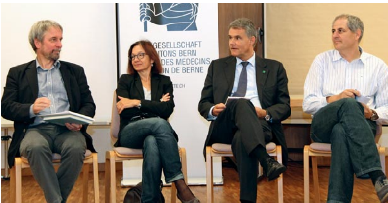
La session extraordinaire de 2014 était totalement placée sous le signe de la recherche de points communs profitables aux médecins et aux pharmaciens.

Comme auparavant, le Tribunal administratif fédéral ne se prononce pas sur le conflit opposant les hôpitaux publics du canton de Berne et santésuisse, et concernant la valeur du point fixée à CHF 1.16 par le Gouvernement pour la facturation des prestations ambulatoires des hôpitaux.