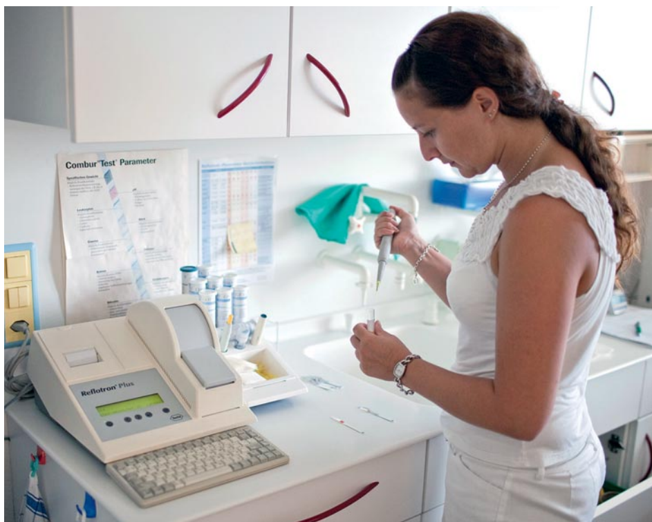
De moins en moins d'AM trouvent une place d'apprentissage – malgré une demande importante.

Lorsque l'on pose la question aux collègues des cabinets de médecine de premier recours, on obtient des histoires de recherches qui ont duré des semaines pour trou-