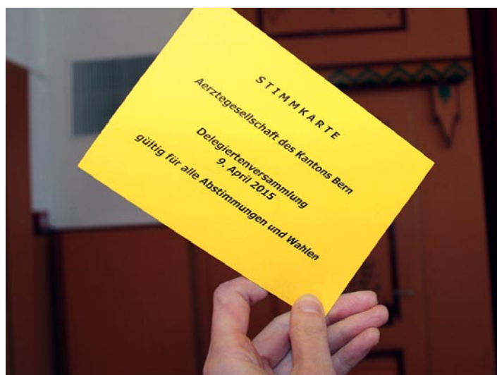
Lors de l'Assemblée, les délégués votent essentiellement sur des affaires statutaires.