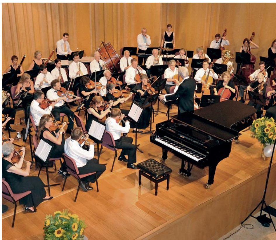
Varié et détenteur: le programme d'orchestre symphonique de l'orchestre des médecins de Berne.

Medifuture – l'orientation de carrière pour médecins de l'ASMAC – est un événement annuel pour les jeunes médecins au début de la planification de leur carrière, où la SMCB est régulièrement présente avec un stand, et où les échanges entre les praticiens et les personnes intéressées rencontrent chaque année un vif intérêt. Ce succès ne peut bien sûr pas se mesurer avec des chiffres.