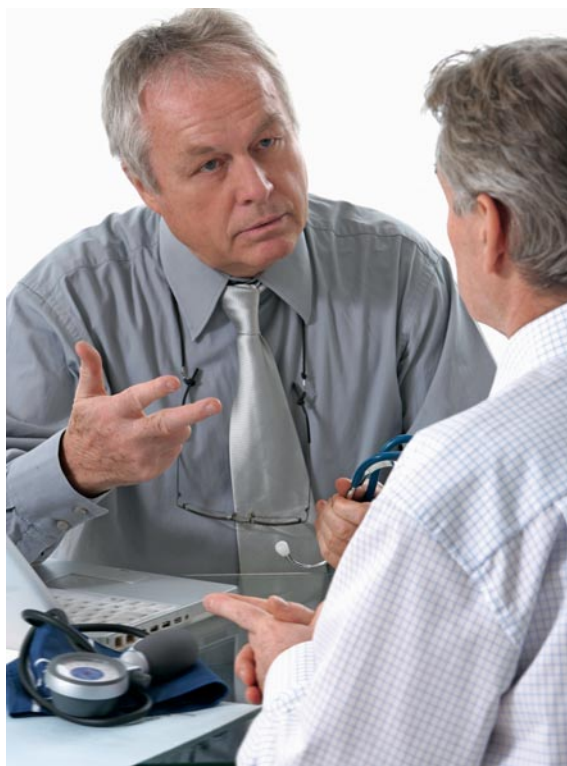
Die BEKAG kritisiert, dass sich das neue Spitalversorgungsgesetz über die privatärztliche Tätigkeit ausschweigt.

Der genaue Wortlaut der Stellungnahme ist auf der Website der BEKAG aufgeschaltet: www.berner-aerzte.ch .