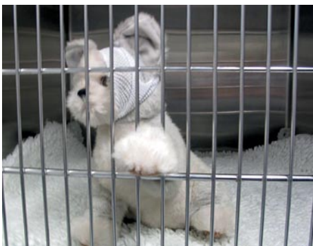
Tiermedizinische Praxisassistentinnen üben praktische Eingriffe an Stofftieren.