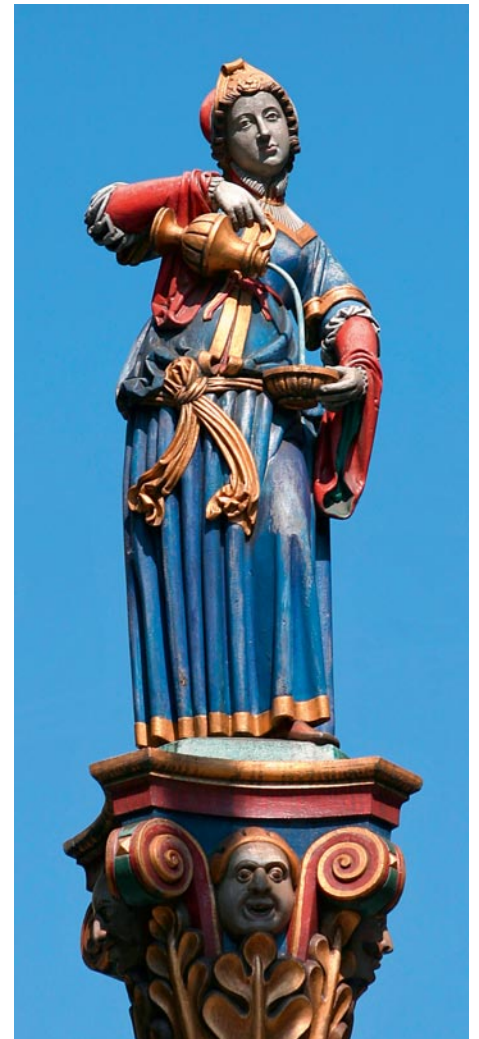
Der Brunnen wurde 1786 zusammengesetzt aus einem modernen Kalksteinbecken, einer römischen Säule aus dem 1. Jahrhundert und der Brunnenfigur aus dem 16. Jahrhundert, nicht Anna Seilerin darstellend, sondern «Temperantia», die personifizierte «Tugend der Mässigung», die Wasser in ein Weingefäss giesst. Der vorher entsprechend seinem Standort «Käfigbrunnen» genannte Brunnen, trägt seinen heutigen Namen erst seit 1847.

Die Finanzierung des modernen Spitalbetriebes wurde mit reichhaltigen Geld- und Naturalzinsen (Ziger, Butter, Erbsen, Gerste, Schweine, Brot etc.) aus Gütern, Alpen und Rechten aus dem Oberland, Mittelland und Emmental mehr als gesichert. Die Seilerin vermachte auch vielen Personen aus ihrem Bekanntenkreis grosszügig Teile ihres Besitzes mit der Bedingung, dass die geschenkten Güter nach dem Tode der Beschenkten an das Spital zurückfallen sollten. Die Burgerschaft der aufstrebenden