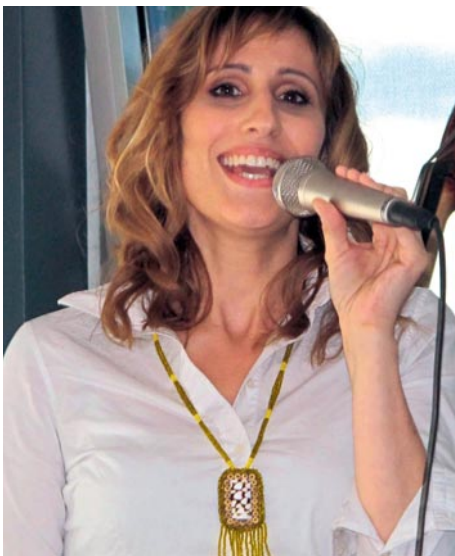
Zwischen den Reden bekamen die geladenen Gäste jazzige Klänge zu hören.

derung von Theorie und Praxis. Die OdA organisiert die überbetrieblichen Kurse, in denen die angehenden Assistentinnen praktische Arbeiten wie Röntgen, Labor oder Assistenz lehren. Im neuen Schulgebäude werden Berufsfachschule und überbetriebliche Kurse vereint. «Eine Win-Win-Situation für alle Beteiligten», ist Haenssler überzeugt. Ihm schwebt bereits der Ausbau des Bildungsangebots vor: «Abgängerinnen sollen sich künftig an der be-med weiterbilden können. Deshalb wollen wir in den nächsten Jahren berufs begleitende Lehrgänge ausbauen».