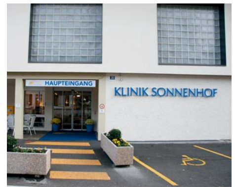
Après l'Inselspital, c'est la Clinique Sonnenhof qui a traité le plus grand nombre de cas d'urgence en 2010.