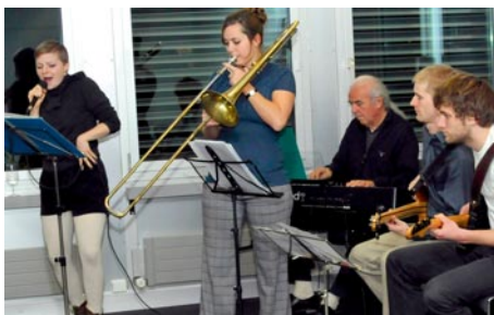
Le «General-medecin-Refunnymations-Band» met l'ambiance pendant l'apéritif et la discussion-débat pour médecins assistants et chefs de clinique.