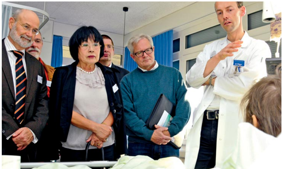
Formation continue au chevet du patient: les participants à une visite en clinique suivent avec intérêt les explications du médecin en charge.