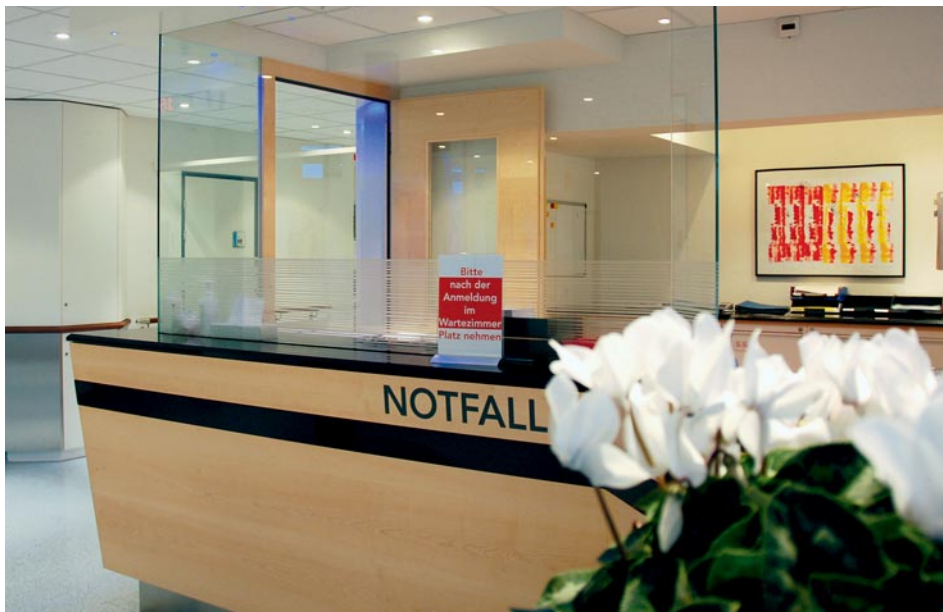
Grâce à l'étroite collaboration entre les médecins urgentistes et les spécialistes, les patients bénéficient de diagnostics rapides.

reconnus par la FMH en chirurgie et en médecine interne générale. Deux médecins cadres et deux chefs de clinique supervisent les médecins assistants. De plus, nous formons deux à trois étudiants chaque année. Nos efforts sont reconnus: dans le dernier sondage FMH sur les centres de formation continue, la Clinique Sonnenhof a obtenu des évaluations pour la plupart supérieures à la moyenne. C'est une des raisons pour lesquelles nos postes de formation sont très appréciés par les futurs médecins de premier recours.