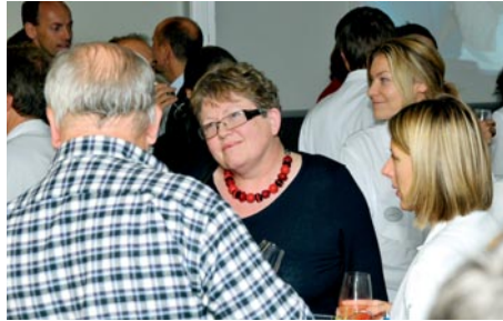
Jeunes et moins jeunes ont pu dialoguer pendant l'apéritif et la discussion-débat pour médecins assistants et chefs de clinique.