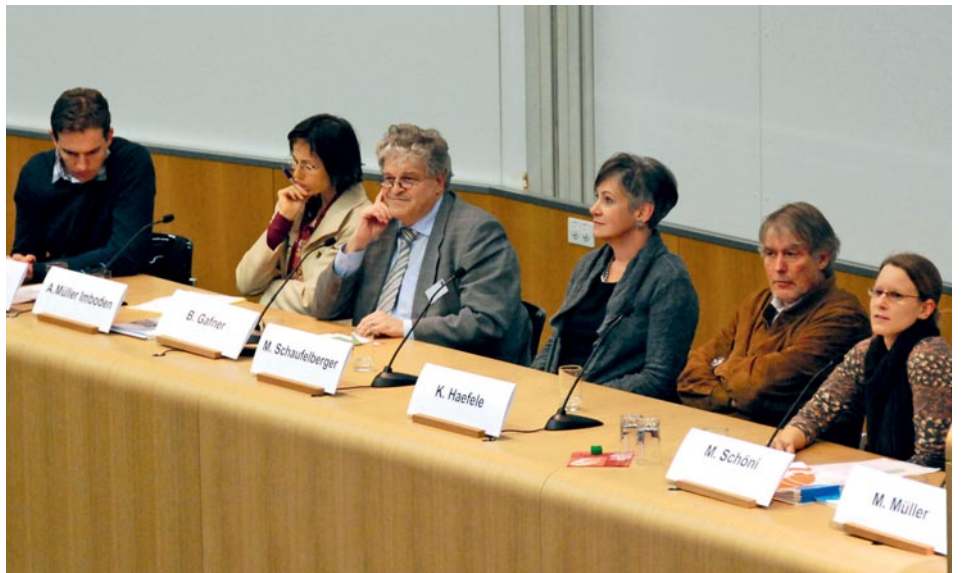
D'illustres intervenants ont pris part à la discussion-débat.