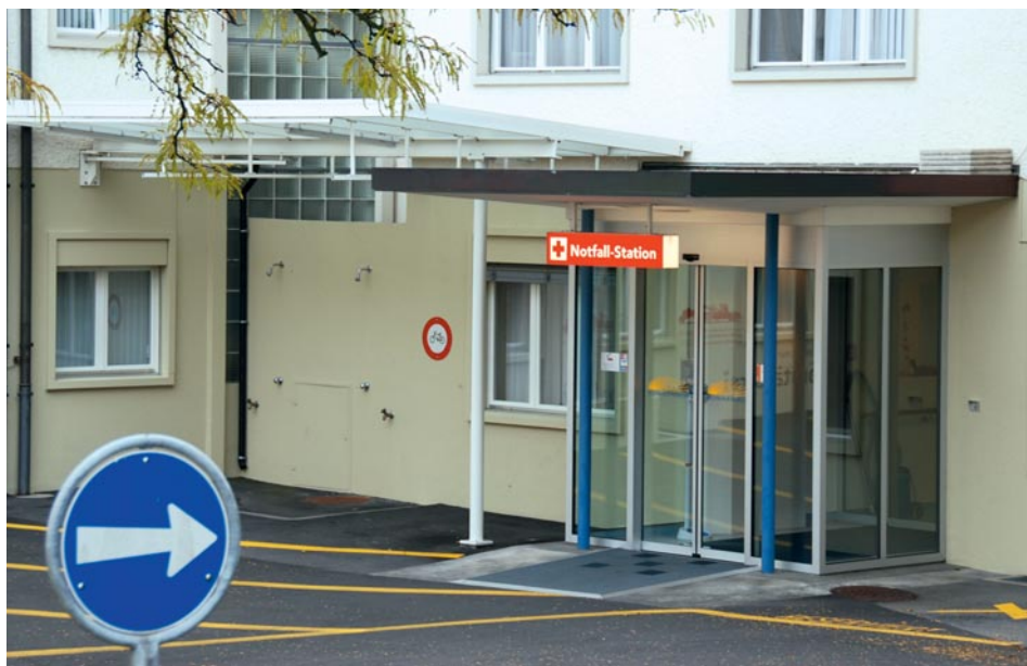
Le centre des urgences de la Clinique Sonnenhof est un centre de formation continue reconnu par la FMH et jouit d'une bonne réputation.