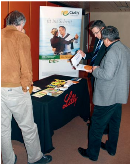
Les exposants ont apprécié le contact personnel avec les médecins praticiens.