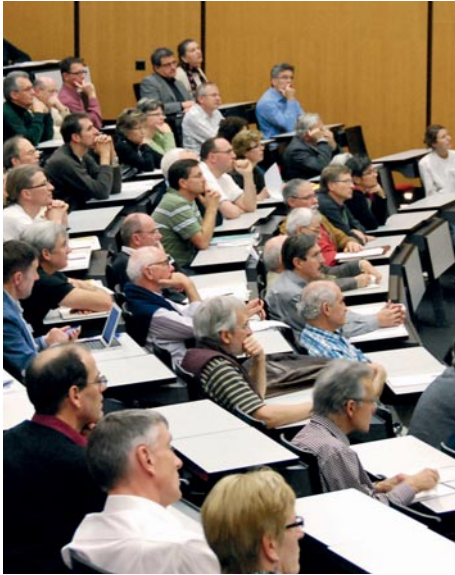
Auditeurs attentifs au séminaire de politique professionnelle.

En 2011 aussi, les journées de formation continue et pratique ont attiré des centaines de médecins à l'Inselspital. L'offre leur était destinée.