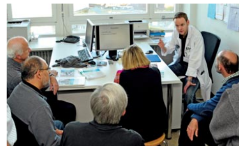
Les nombreux ateliers ont suscité un vif intérêt.