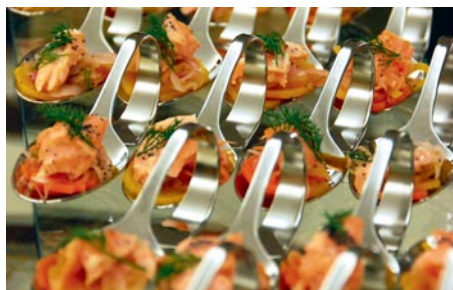
Le bien-être du corps n'a pas été oublié.