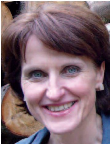
Franziska Teuscher Nationalrätin. Biologin. Mitglied der sozial- und gesundheitspolitischen Kommission und der Kommission für Verkehr und Fernmeldewesen des Nationalrates Bern / Grünes Bündnis www.franziskateuscher.ch

rapien der Komplementärmedizin vermittelt werden. Neue Formen der Zusammenarbeit wie Managed Care erachte ich als Chance. Ein Risiko ist die Abwertung der Grundversorgung durch die Schaffung von so genannten Eurodocs mit verkürzter Ausbildung an einer Fachhochschule. Als Ständerätin setze ich mich für eine Stärkung der Hausarztmedizin mit fairen Arbeitsbedingungen für die Ärztinnen und Ärzte und für Modelle zur Finanzierung der Praxisassistenz ein. Als Konsumentenschützerin will ich die Medikamentenpreise weiter senken und verhindern, dass die Krankenkassenprämien nach der Auflösung von Reserven ins Uferlose steigen.