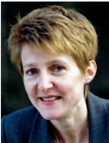
Simonetta Sommaruga Ständerätin Präsidentin der Stiftung Konsumentenschutz Bern / SP www.sommaruga.ch

Die Hausarztmedizin muss wieder ins Zentrum der Gesundheitsversorgung rücken. Sie ist in der universitären Ausbildung zu stärken, gleichzeitig sollen sich Hausärztinnen und -ärzte vermehrt an den Bedürfnissen der Bevölkerung orientieren. So soll im Medizinstudium auch Basiswissen über qualifizierte The-