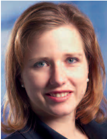
Christa Markwalder Bär Nationalrätin Juristin Burgdorf / FDP www.christa-markwalder.ch

Seit 2003 engagiere ich mich im Nationalrat für eine liberale, offene und fortschrittliche Schweiz. Ich setze mich als Vertreterin der jungfreisinnigen und der FDP für Wirtschaftswachstum, für ausgezeichnete Bildung von der Primar- bis zur Hochschule, für mehr Generationengerechtigkeit sowie für eine offene und tolerante Gesellschaft ein.