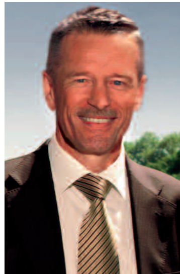
Werner Luginbühl Regierungsrat Vorsteher der Justiz-Gemeinde- und Kirchendirektion des Kantons Bern Krattigen / SVP www.werner-luginbuehl.ch

gung im Schweizer Gesundheitswesen gehören kompetente und motivierte Hausärztinnen und -ärzte und Spezialärzte und -ärztinnen. Umweltbelastungen, Stress am Arbeitsplatz und gesellschaftliche Benachteiligung gehören zu den wichtigsten krankmachenden Faktoren. Hausärzte, die in Pension gehen, finden häufig keinen Nachfolger, weil die jungen Ärztinnen und Ärzte in die Städte bleiben, wo sie bessere Arbeitsbedingungen vorfinden. Wenn wir die Kosten im Gesundheitswesen wirklich senken wollen, müssen wir gesunde Lebensbedingungen erhalten und schaffen, gesundheitsgefährdete Lebensbedingungen bekämpfen und verhindern. Wir müssen die Bedingungen der Hausärztinnen und -ärzte verbessern, sie von der Bürokratie entlasten und sie stärker in die politische Debatte miteinbeziehen. Mehr Umweltschutz und mehr Hausärztinnen und Hausärzte, dann steigen die Prämien nicht mehr steil wie bisher.