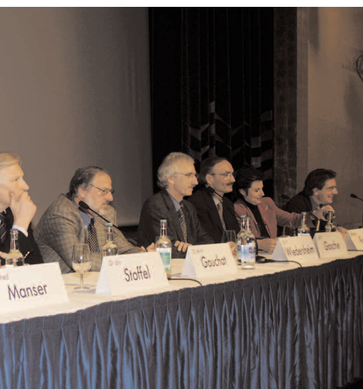
Gesundheitswesens trafen sich zur Diskussion

Marco Tackenberg, Presse- und Informationsdienst